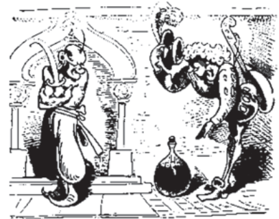
Der Ritter Artur sucht voll Tücken Des Hauses Wächter zu berücken.

zumindest eine Karikatur im Rahmen eines künstlerischen Werks. Es ist recht seltsam, einem solchen Produkt des 18. Jahrhunderts den Mangel an political correctness vorzuwerfen und für uns heute zu glauben, die Meinungs- und künstlerische Freiheit und damit das Recht auf Satire und Karikatur als Grundlage der liberalen Welt verteidigen zu müssen.