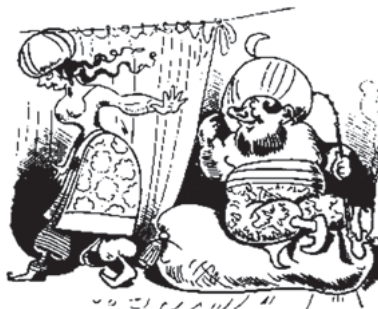
Der Sultan winkt – Zuleima schweigt Und zeigt sich gänzlich abgeneigt.

Es gibt mehrere Einwände. Zum einen gibt es in der Zeit auch die Faszination des Orientalischen und die «alla turca»-Mode, an der Mozart ebenfalls Anteil nimmt. So Hass gesteuert scheint das Türken-Bashing nicht gewesen zu sein und wie weit es «politisch» verstanden sein wollte, ist noch die Frage. Zum anderen sollte man nicht ausser Acht lassen, dass es sich beim Stück um ein Singspiel handelt, das im weiteren Sinn zur Gattung der Komödie gehört. Osmin ist ein komischer Charakter, oder