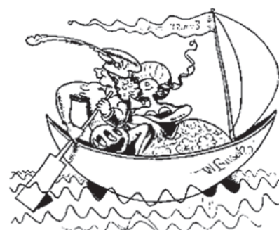
Das Pärchen aber, froh und heiter, Entflieht per Schiff und segelt weiter.