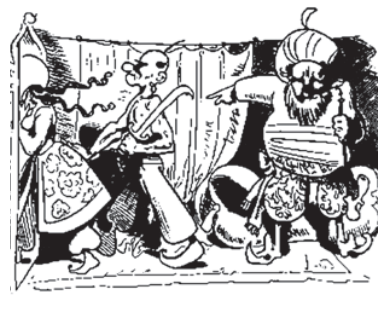
»Ha!« ruft der Sultan zorn'gen Muts, »Führt sie hinweg!!« – Der Sklave tut's.