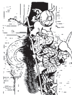
Die beiden Türken steigen nach Bis zu Zuleimas Vorgemach.