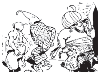
Dem Sultan aber klopft das Herz Vor Herzenspein und Nasenschmerz.