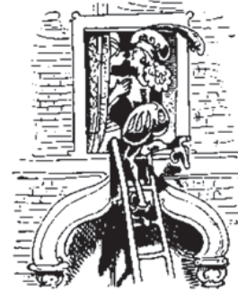
Hier grüßt man sich voll Zärtlichkeit – – Gebt acht! der Aga ist nicht weit!