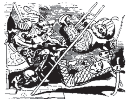
Kaum sind die beiden Türken oben, Da wird die Leiter umgeschoben.