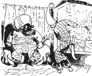
Schon trinkt die Wache ziemlich viel, Herr Artur stimmt sein Lautenspiel.

Kurz zusammengefasst, handelt es sich beim Bassa – im Rahmen einer Dramaturgie, die die Komödie auch als Lehrstück begreift und das Theater als «moralische Anstalt» – um eine Figur von nicht nur psychologischem, sondern prinzipiellem Zuschnitt. «Ich bin ein Teil von jener Kraft, die stets das Böse will und stets das Gute schafft» lässt Goethe seinen Mephisto sagen. Für den Bassa Selim, der eine ebenso schillernde Figur ist, könnte auch gelten, dass er im Bösen schafft, weil er das Gute will.