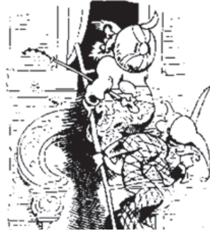
Jetzt ist die Schildwach' schon betrunken, Und schau! Zuleima hat gewunken.