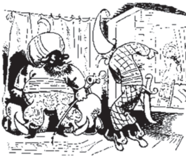
Der ruft: »Herr Sultan, kommt in Eil! Grad steigt da wer in das Serail!«

BLONDE «Das gilt mir nun ganz gleich. Da es einmal gestorben sein muss, ist mir alles recht.»